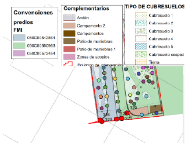
Gráfica 1: Vista general de la ubicación del intercambiador vial en la intersección de la avenida Medellín (calle 80) con avenida las quintas (CARRERA 119) y la carrera 120 en Bogotá D.C.

En la Calle. 80 entre Carrera 119 y Carrera 120, en la localidad de Engativá de la ciudad de Bogotá D.C. para la ejecución del Contrato IDU-636-2024, que tiene por objeto “ELABORACIÓN DE LOS ESTUDIOS, DISEÑOS Y CONSTRUCCIÓN DEL INTERCAMBIADOR VIAL EN LA INTERSECCIÓN DE LA AVENIDA MEDELLÍN (CALLE 80) CON AVENIDA LAS QUINTAS (CARRERA 119) Y LA CARRERA 120 EN BOGOTÁ D.C.”.